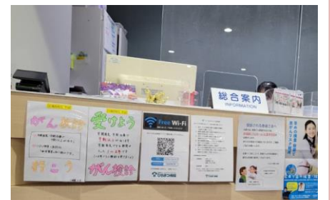
医療法人ひらまつ病院 総合案内前