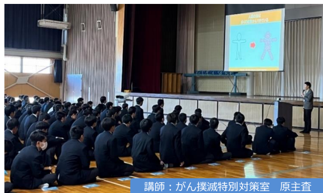
講師：がん撲滅特別対策室 原主査

11月25日(月)伊万里市にある敬徳高等学校の生徒さんに、「がん」を知ってもらおうと出前講座に伺いました。受講者は全校生徒他525名でした。がんの要因や予防法、がんを見つける方法や治療法、佐賀県の現状などをイラストやグラフを使い伝えました。また、子宮頸がん予防のHPV(ヒトパピローマウイルス)ワクチンの『キャッチアップ接種』の紹介もおこないました。生徒さんからは、「がんになっている自覚がなくても、早期のがんになっている可能性があることを知り、自分で気づいたときには既にがんは進行していて、がんが一番多い死因であることに納得しました。私も定期的ながん検診を心掛けたい」とか「がんは早期発見をすれば治る病気であることを知りました」等の声が聞かれました。今回の講演において、生徒さんたちが「がん」の知識を持つことで、自身はもちろんご家族や周囲の方々への意識が変わってくれることを願っています。