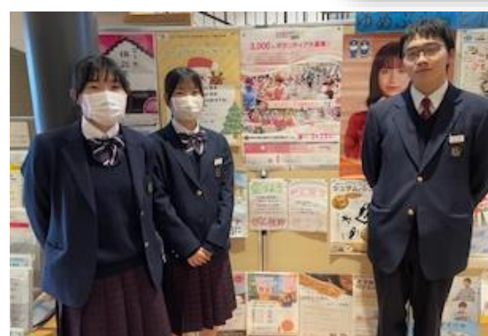
小城高等学校の皆さん(ゆめぶらっと小城にて)