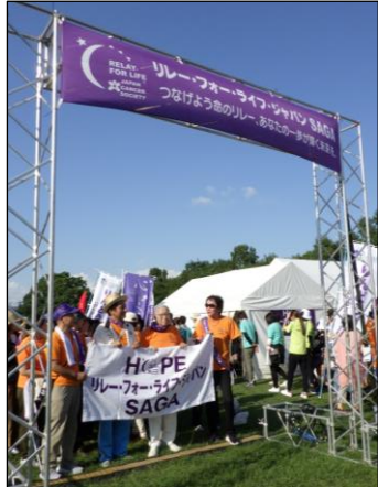
サバイバースウォークスタート

9月のがん征圧月間に合わせ、がん征圧・患者支援チャリティイベント「リレー・フォー・ライフ・ジャパン 2024 佐賀 10th Anniversary」が佐賀市のどんだの森で開催されました。28日（土）15時半から翌日の29日（日）11時までの二日間の開催となり、大勢の方々が参加され交流を深めました。