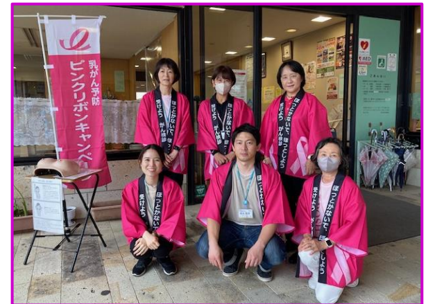
伊万里市民図書館