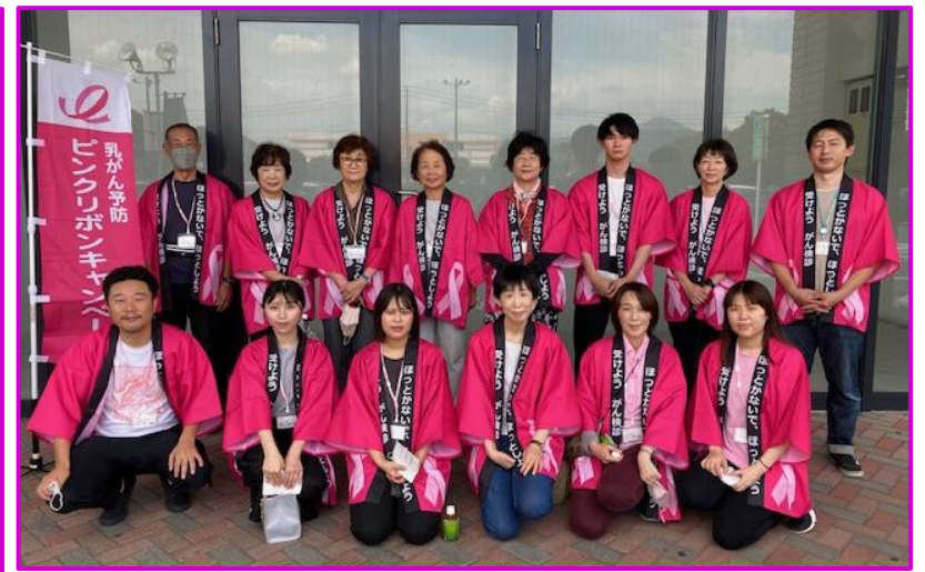
イオン唐津ショッピングセンター

『乳がん』は自分で見つけることのできる唯一のがんです。 ◇指で触れてチェック お風呂やシャワーの時に、石鹸がついた手で触れると乳房の凹凸がよくわかります。 ◇鏡の前でチェック ひきつれ、くぼみ、乳輪の変化等ないか確認します。